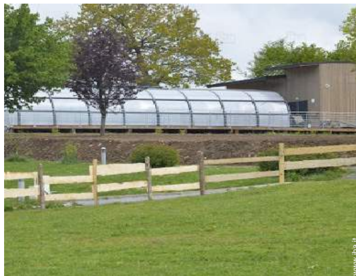
disposizione delle attrezzature ricreative