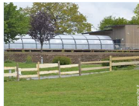
disposizione delle attrezzature ricreative

Villaggio centro 800m Panetteria 800m Negozi tipici 800m Supermercato 7,5km Ufficio postale 800m Distributore automatico di biglietti 7,5km Farmacia 7,5km Medico 7,5km Infermiera 7,5km