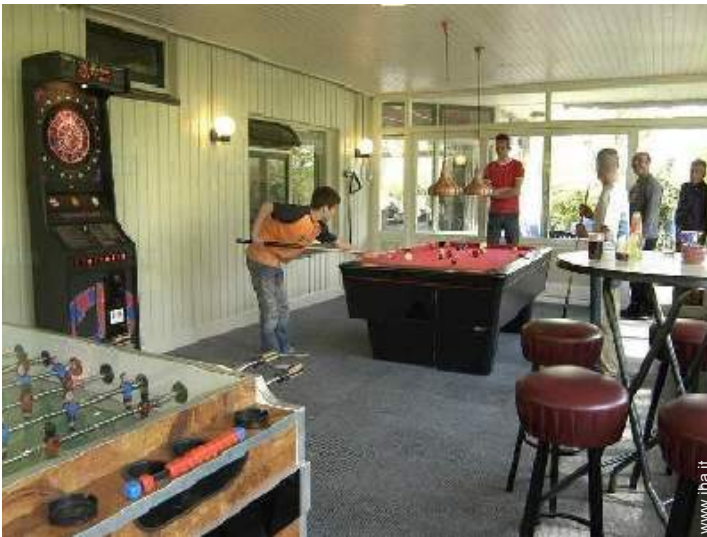
sala dei giochi