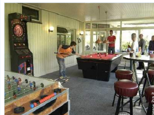
sala dei giochi