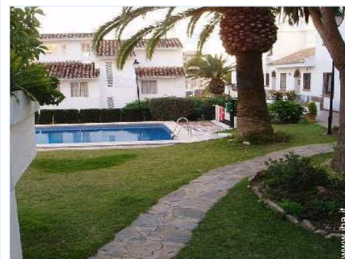
piscina in comune