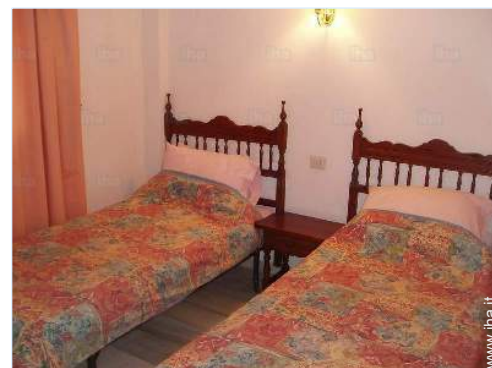
stanza degli ospiti

Barbecue, tavolo da giardino, 4 sedia(e) da giardino, ombrellone, 2 sedia sdraio