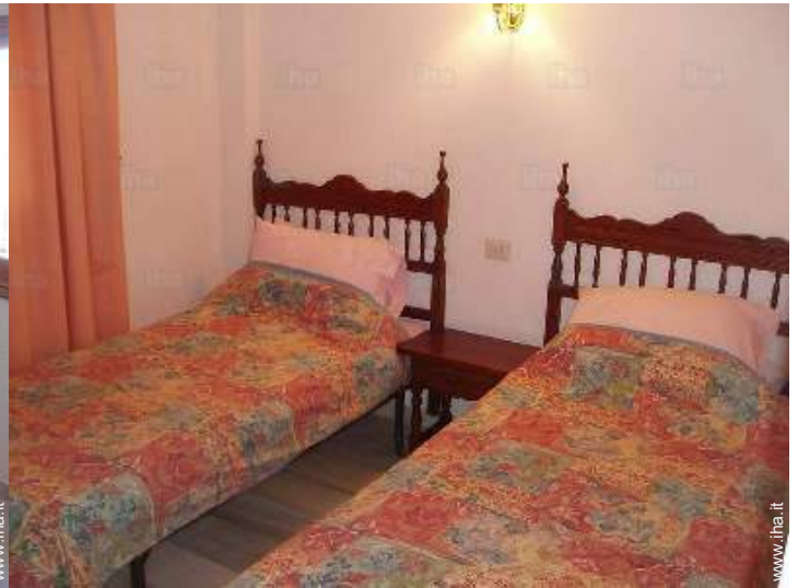
stanza degli ospiti