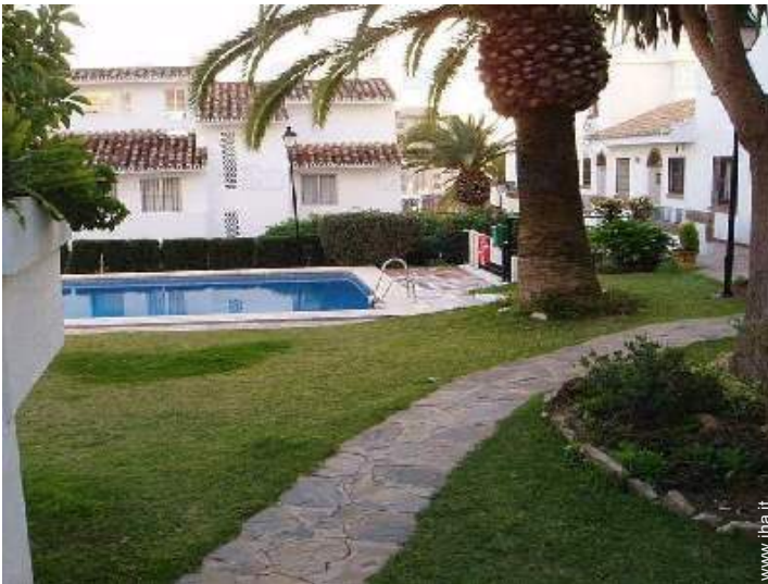
piscina in comune