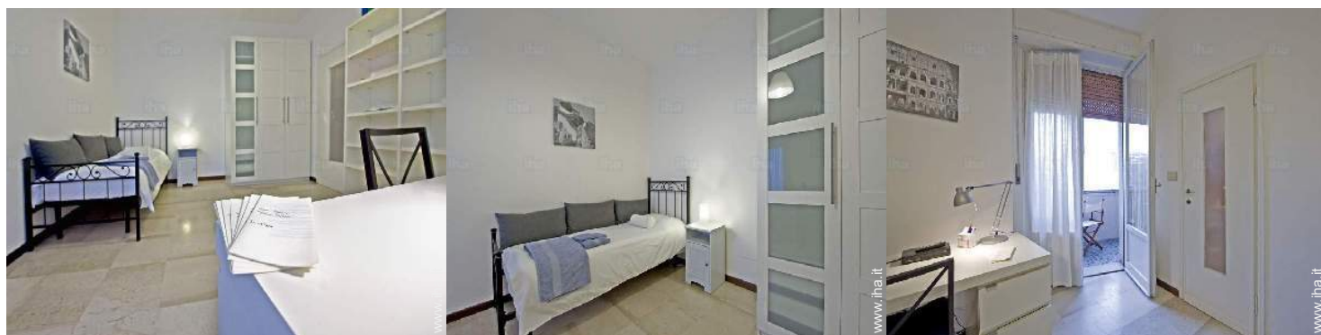
Disposizione interna e comfort