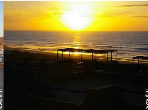
vista dal terrazzo