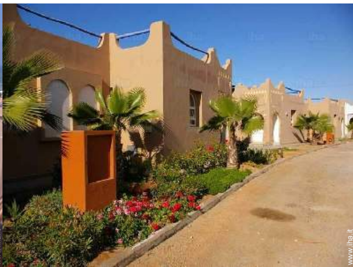
vista dalla proprietà