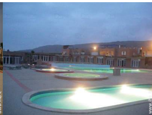
piscina in comune