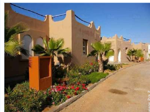
vista dalla proprietà