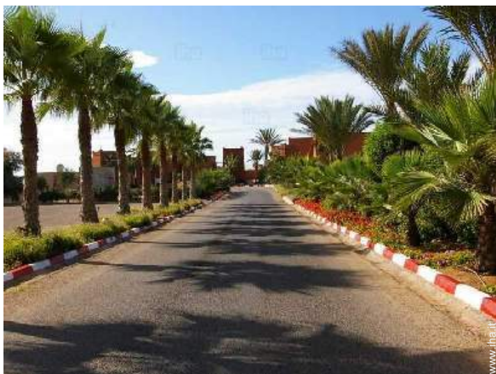
Apprezzamento di terreno