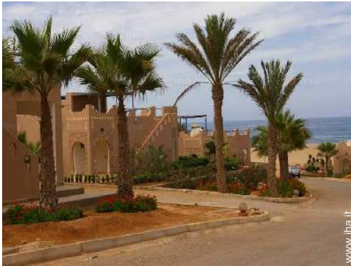
accesso diretto alla spiaggia