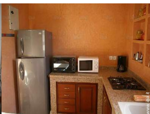
cucina in stile americano