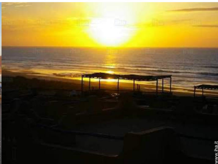
vista dal terrazzo