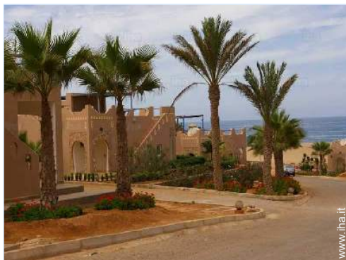
accesso diretto alla spiaggia