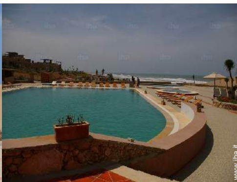
piscina in comune