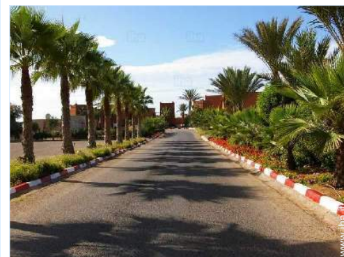
Apprezzamento di terreno