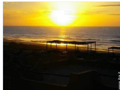
vista dal terrazzo