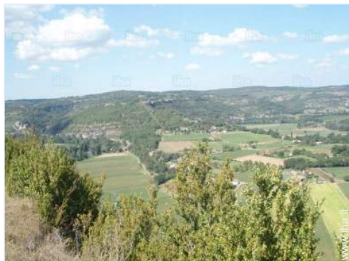
vista sulla campagna