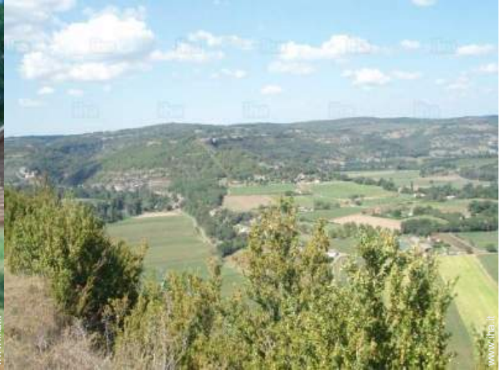
vista sulla campagna