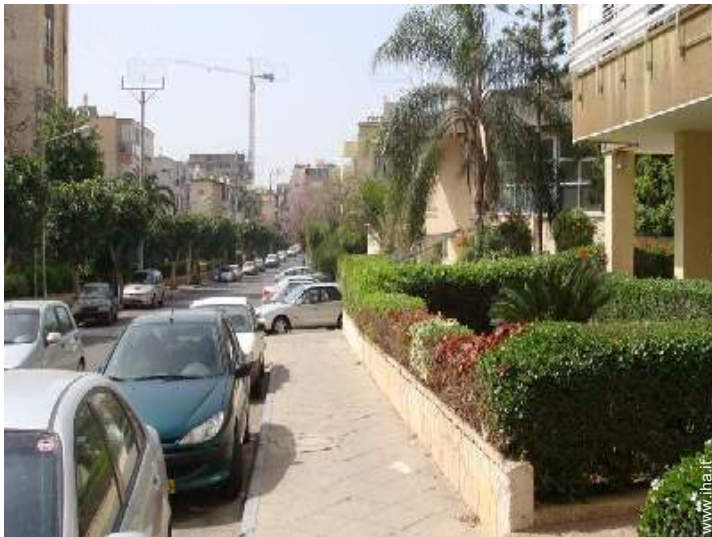
vista sulla strada/viale