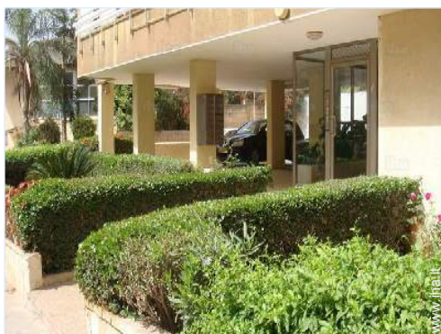
vista sulla strada/viale