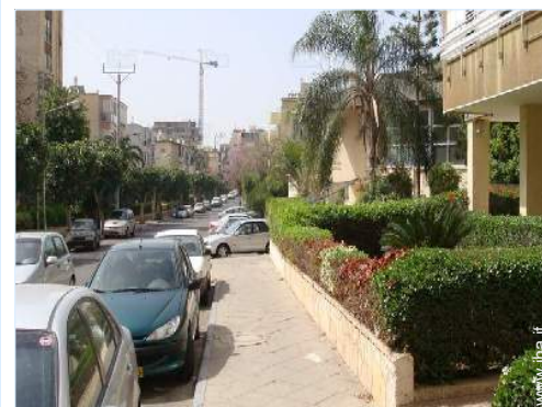
vista sulla strada/viale