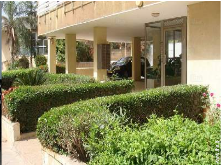
vista sulla strada/viale