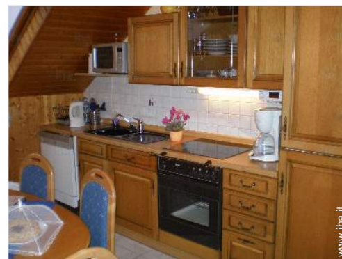
grande cucina indipendente

Percorso di golf 18 buche 30km Base aeronautica 30km Punto di windsurf 3km Centro nautico 5km Fiume 5km Lago 3km Foresta 200m Marina 5km Scalo di alaggio per la barca 7,5km