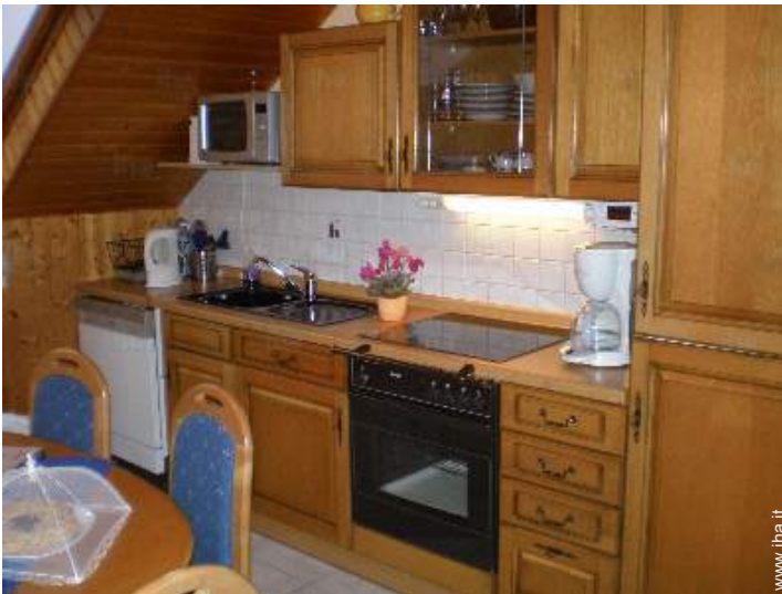
grande cucina indipendente