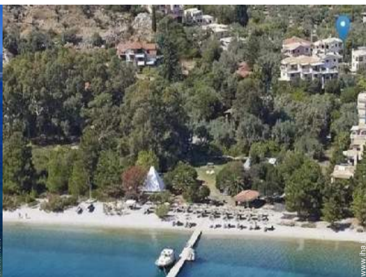
vista sul mare