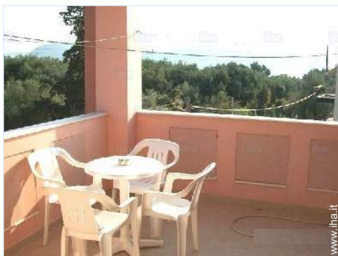
vista dalla veranda