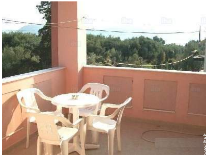
vista dalla veranda