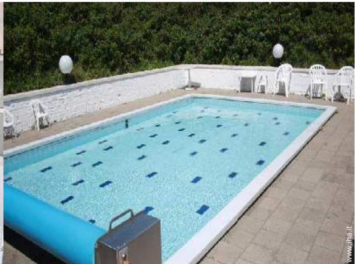
piscina in comune