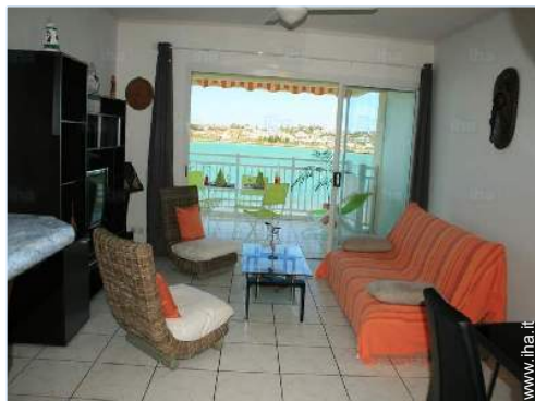
vista dal salone

Privilegi : Accesso diretto alla spiaggia