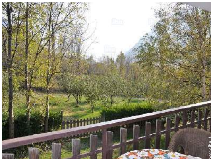
vista dal terrazzo coperto