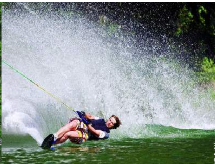
disposizione delle attrezzature ricreative