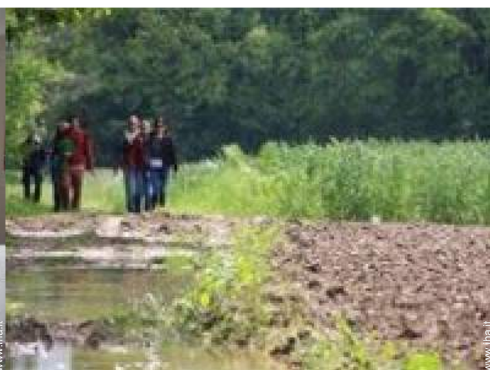
attrezzature ricreative nelle vicinanze