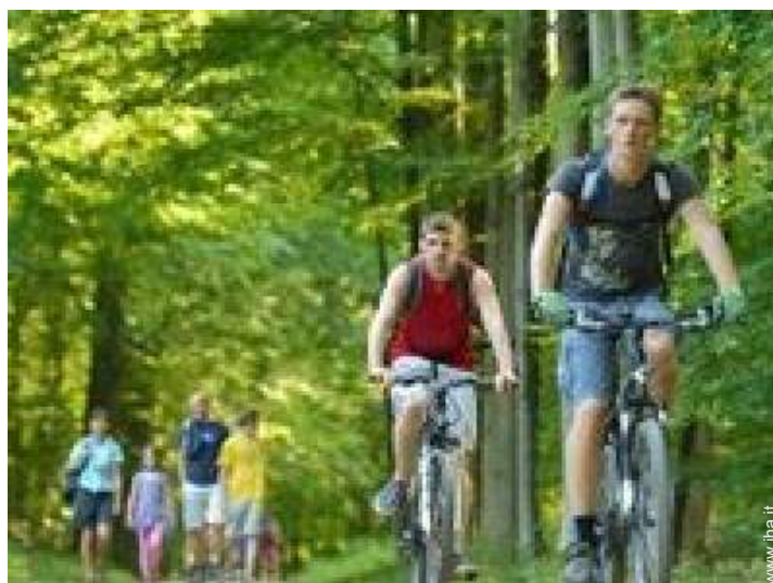
attrezzature ricreative nelle vicinanze