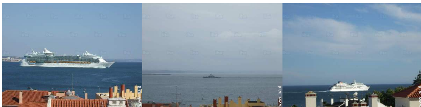
vista dalla veranda