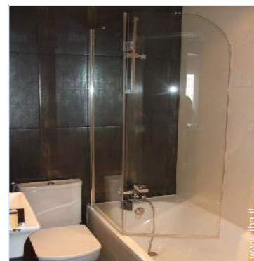
Comfort interno ed attrezzature

Asilo 100m Centro città <50m Fermata/stazionamento bus 100m Noleggio auto 2km Noleggio biancheria/lavanderia 50m Panetteria <50m Traiteur <50m Negozi tipici <50m Supermercato <50m Negozi di alta classe e di lusso 1km Salone di coiffure <50m Ufficio postale <50m Banca <50m Distributore automatico di biglietti <50m Farmacia 50m Medico 100m Ospedale 1km Ambulatorio 100m