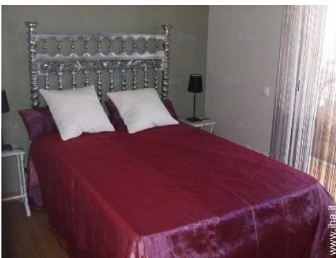
camera per ragazzi