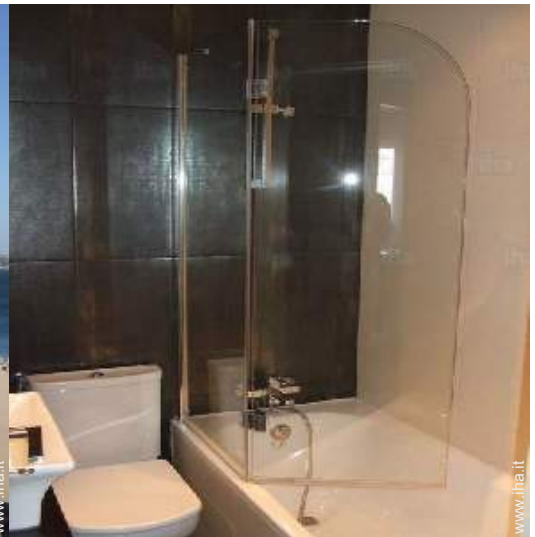
Comfort interno ed attrezzature