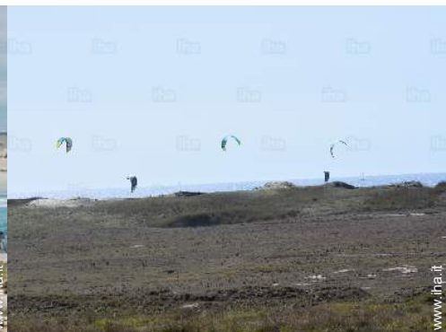
attrezzature ricreative nelle vicinanze