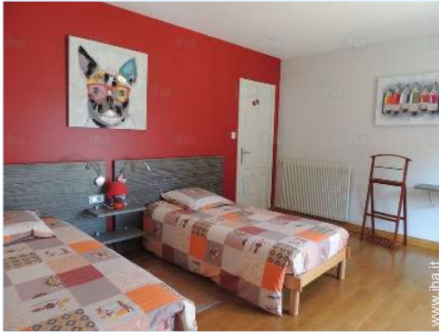
camera dei bambini