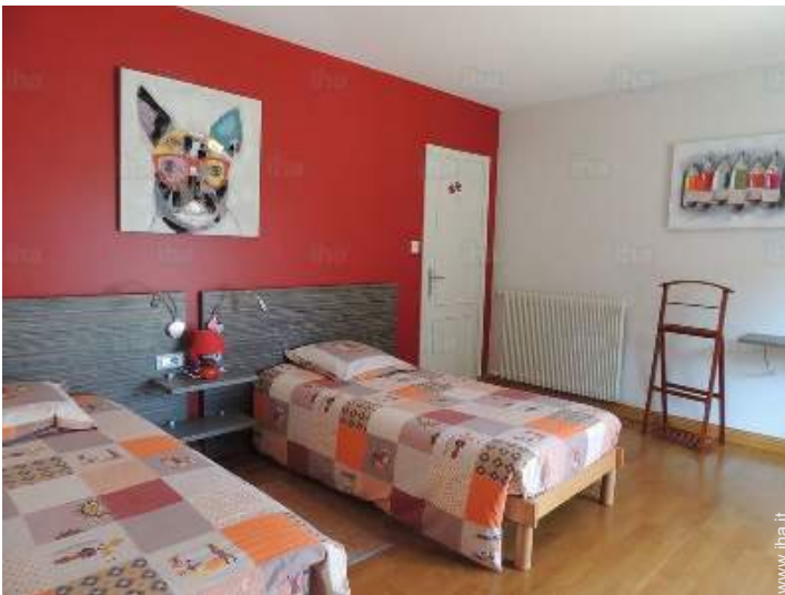
camera dei bambini