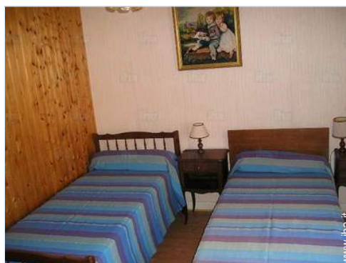
camera per ragazzi