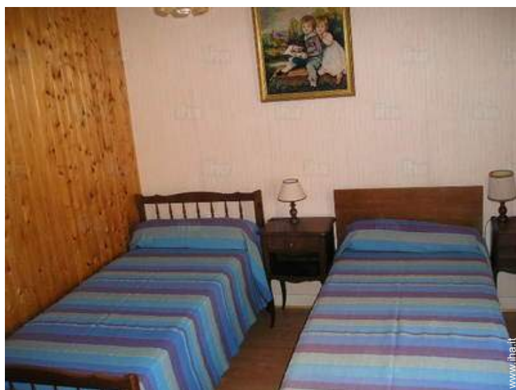
camera per ragazzi