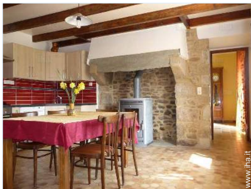
grande cucina indipendente