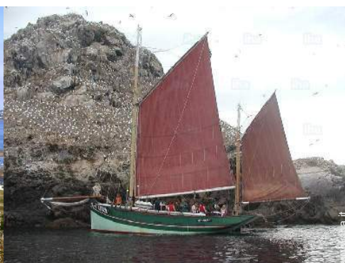
attrezzature ricreative nelle vicinanze