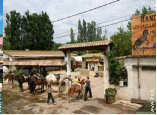
passeggiata a cavallo