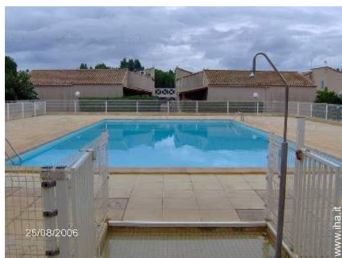
piscina in comune