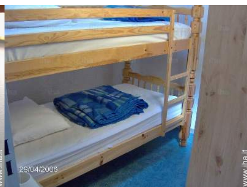
letti a castello