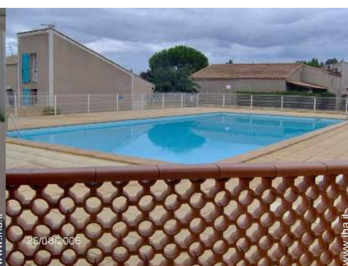
piscina in comune