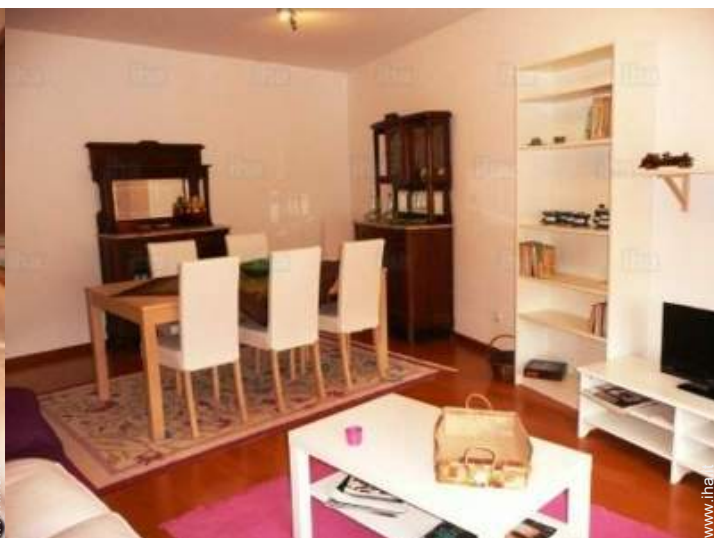
sala da pranzo