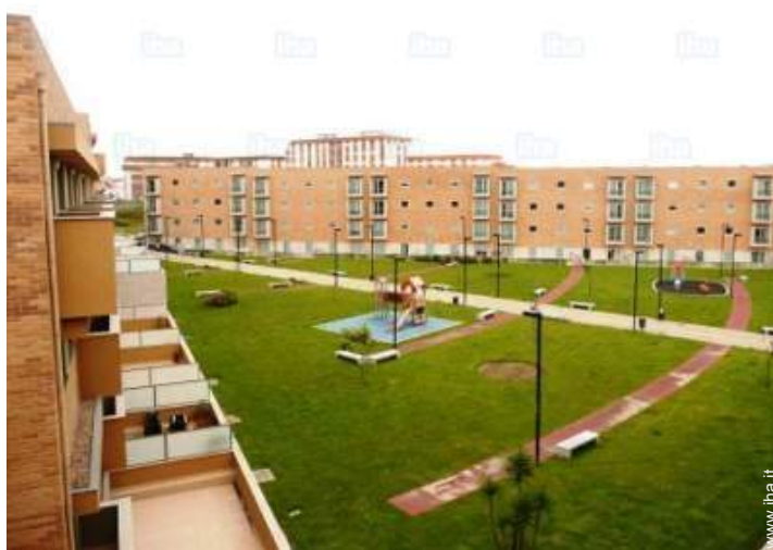
vista sul giardino/parco