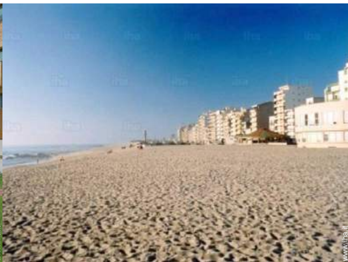
attività balneari nelle vicinanze