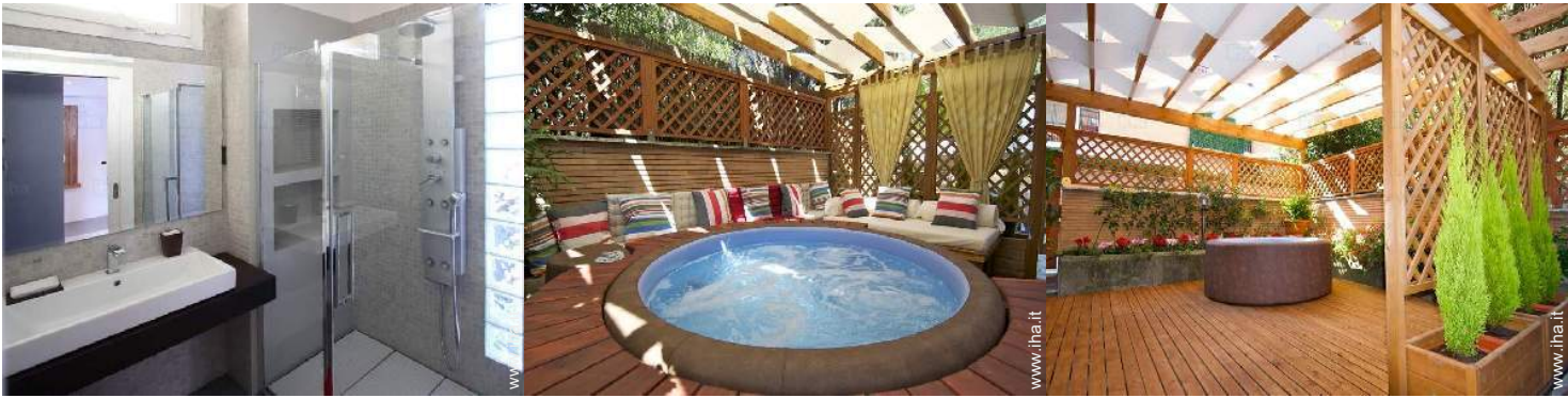
vista sul giardino/parco