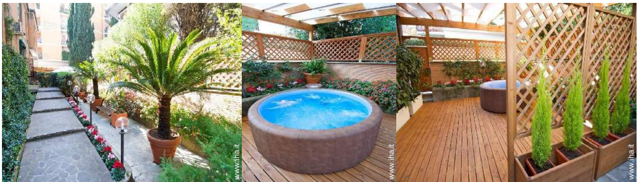
vista sul giardino/parco