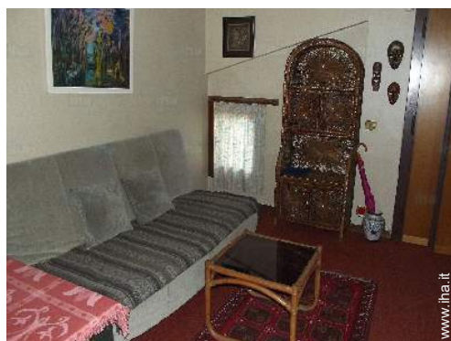
divano(i) letto 1 pers