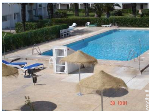
piscina in comune

Privilegi : Accesso diretto alla spiaggia