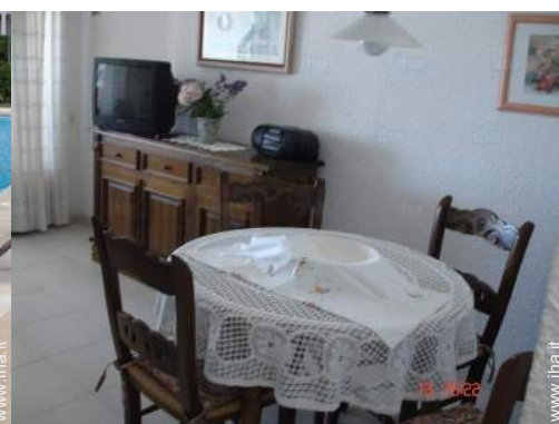
piscina in comune