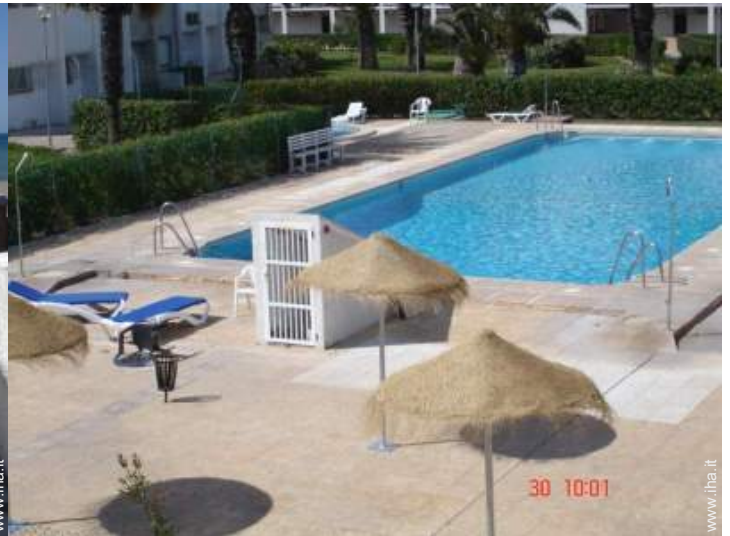
piscina in comune