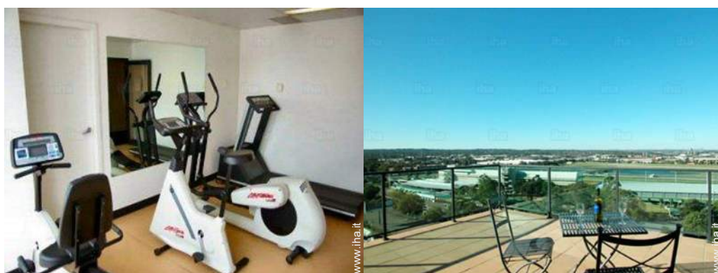
attrezzo(i) per il fitness