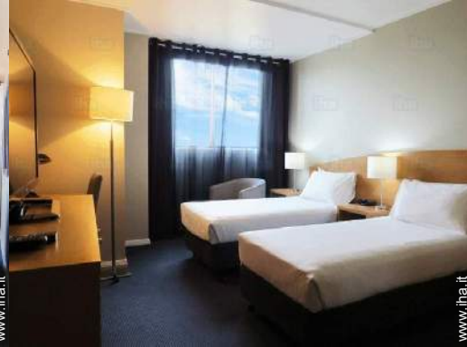
possibilità letto(i) supplementare(i)