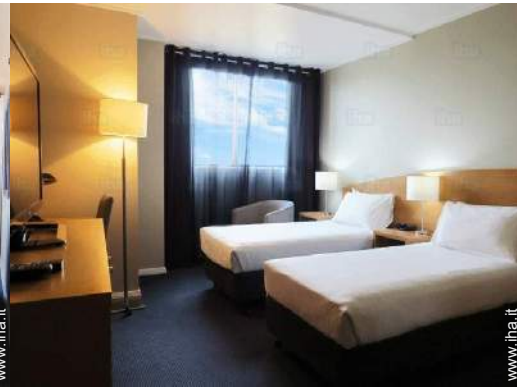
possibilità letto(i) supplementare(i)