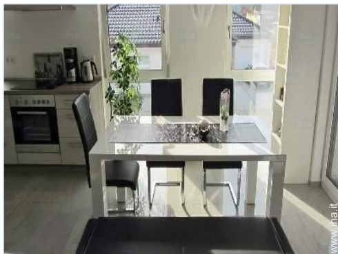
vista dalla sala da pranzo