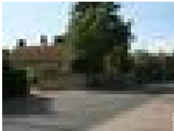
vista sulla strada/viale