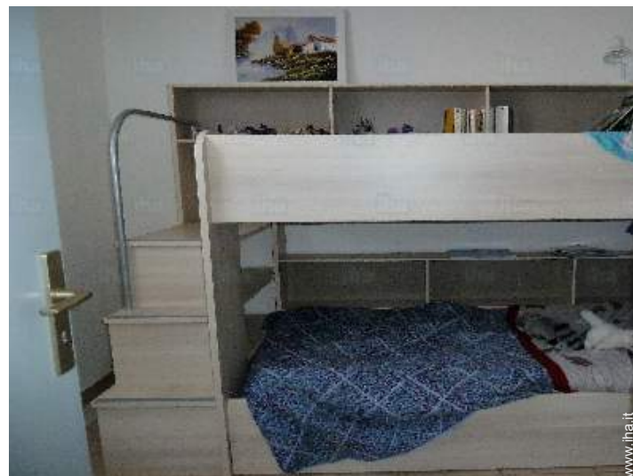
letti a castello