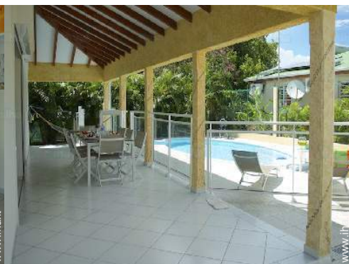
vista dalla veranda