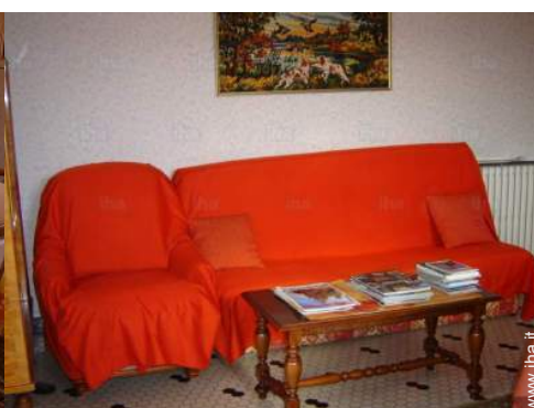
possibilità letto(i) supplementare(i)