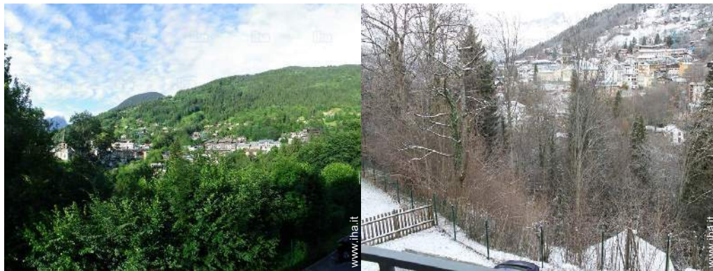
vista dal salone