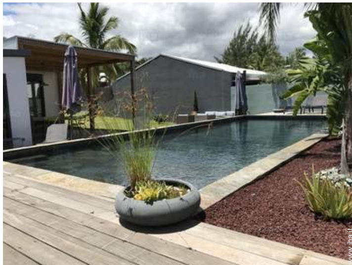
vista dalla piscina