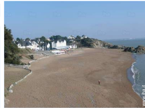
vista sul mare