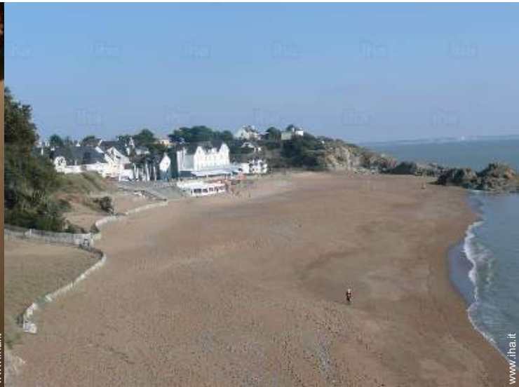
vista sul mare