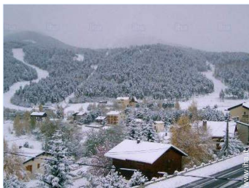
vista dal soggiorno