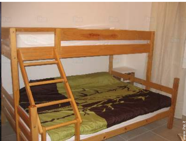
camera dei bambini