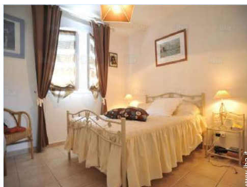
stanza degli ospiti