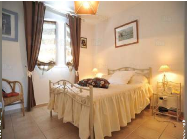
stanza degli ospiti