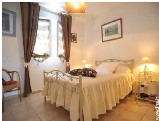
stanza degli ospiti