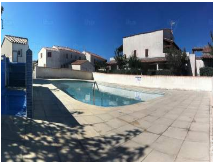
piscina in comune