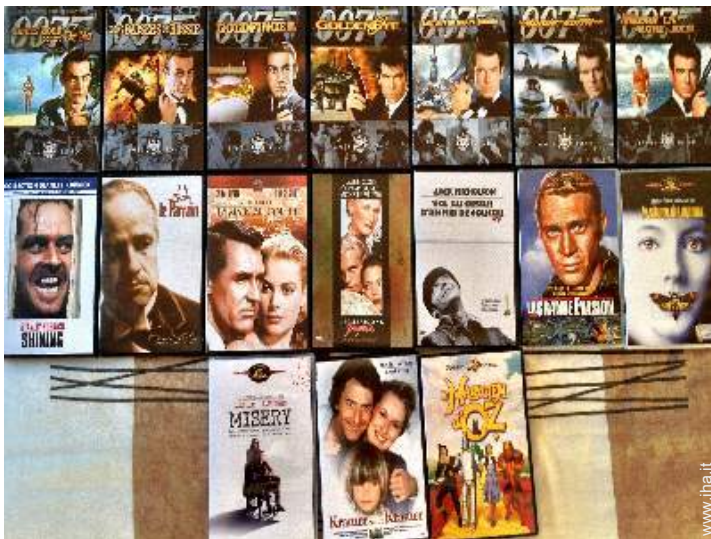
collezione di film