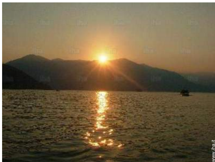
vista sul tramonto