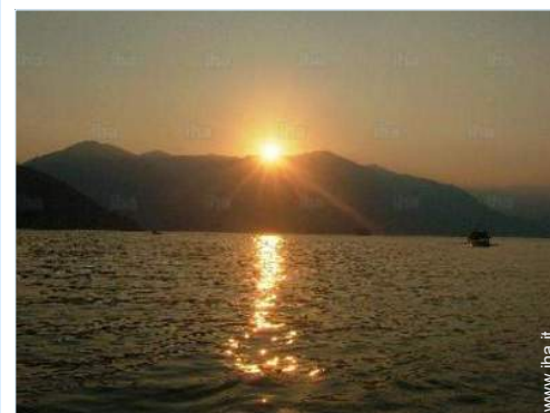
vista sul tramonto