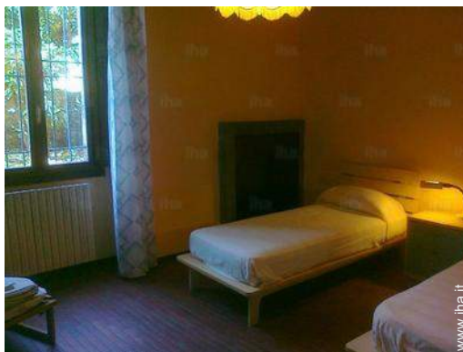
camera per ragazzi