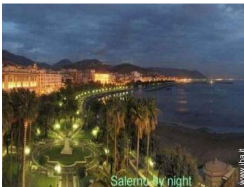
Salerno by night Città