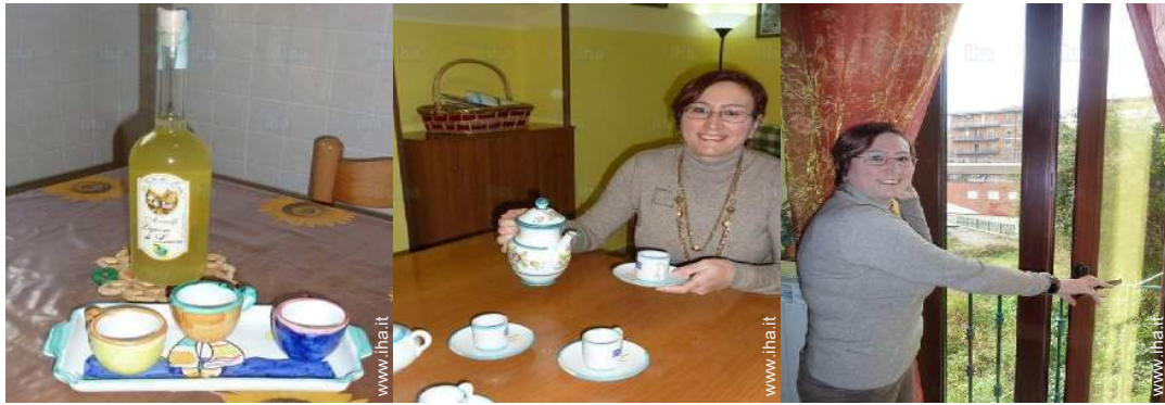
utensili e batteria da cucina