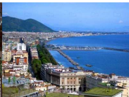
vista sulla città