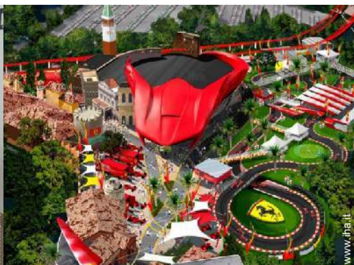
parco dei divertimenti