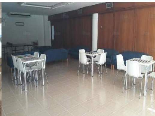
sala dei giochi