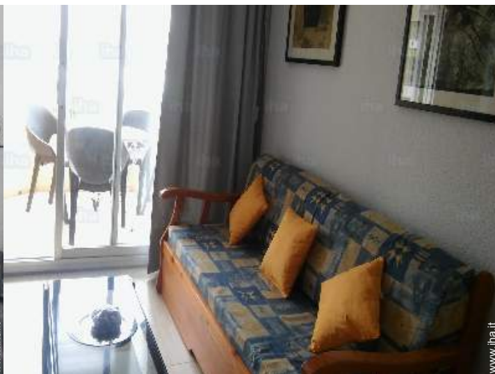
divano(i) letto 2 pers