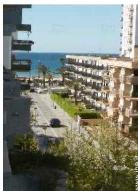
vista dal terrazzo coperto