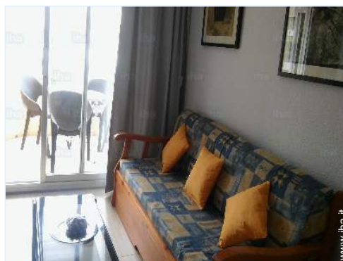
divano(i) letto 2 pers