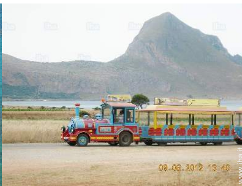
attività balneari nelle vicinanze