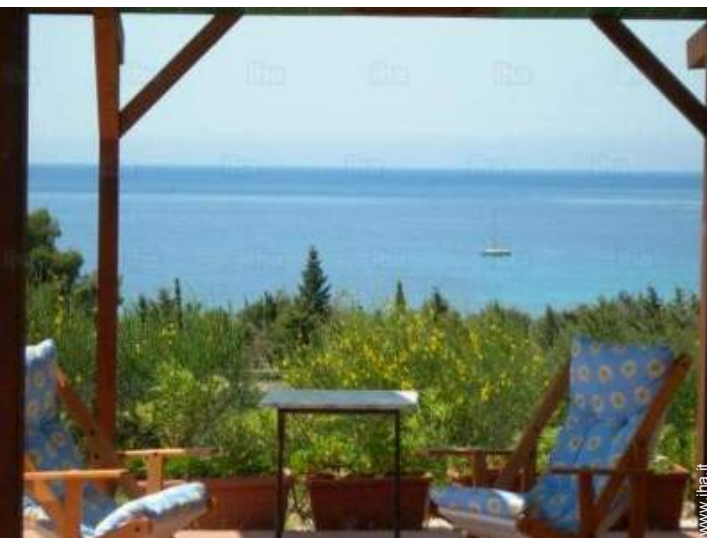
vista dalla camera