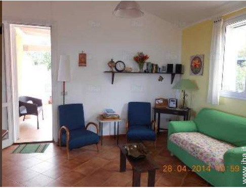
vista dal soggiorno