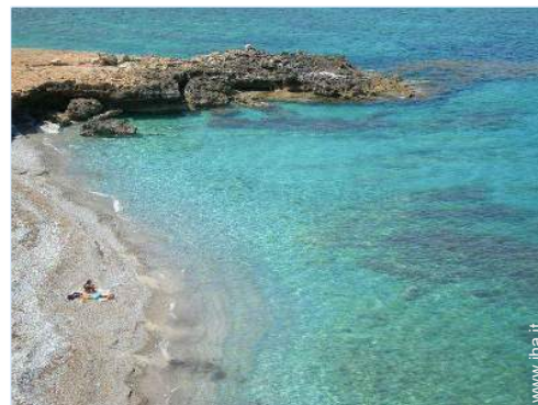
spiaggia con ciotoli