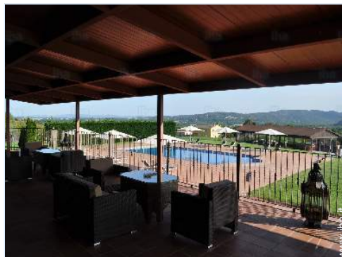
vista dal terrazzo coperto