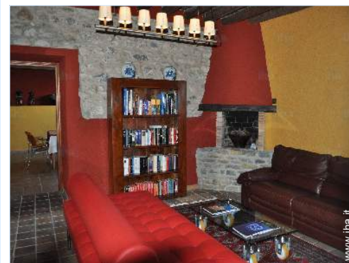
collezione di libri