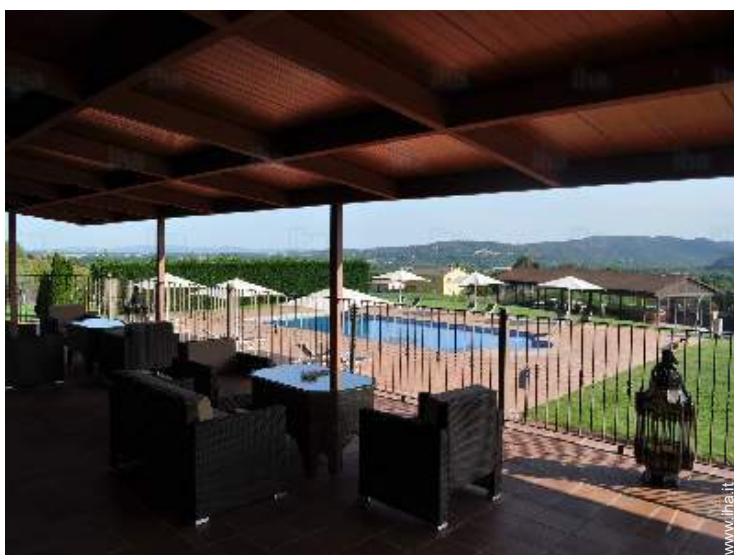
vista dal terrazzo coperto