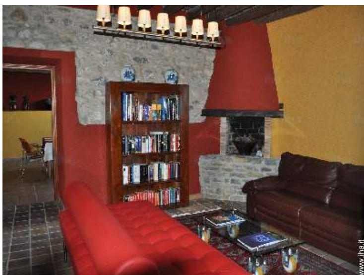
collezione di libri