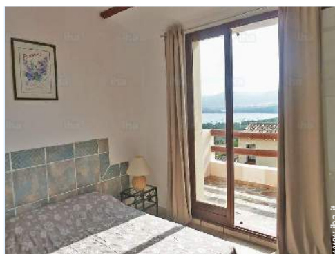
vista dalla camera