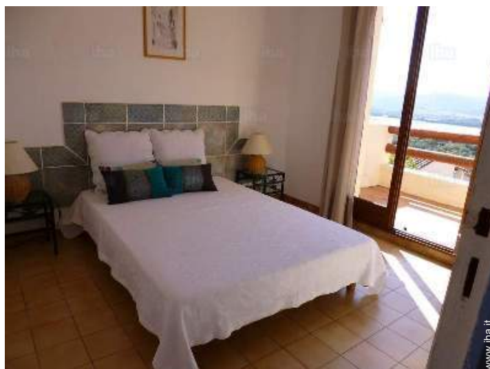
vista dalla camera