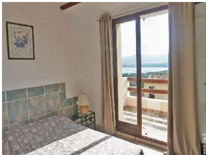
vista dalla camera