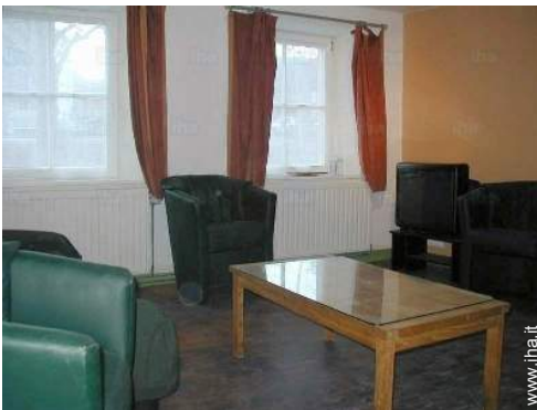
salone con televisore