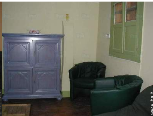
salone con televisore