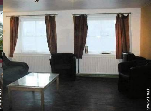
salone con televisore