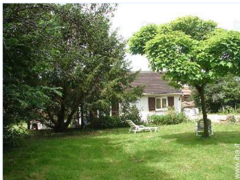
vista dalla proprietà