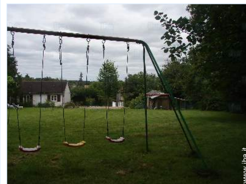
disposizione delle attrezzature ricreative

Piscina pubblica 7,5km Fiume 10km Specchio d'acqua 1km