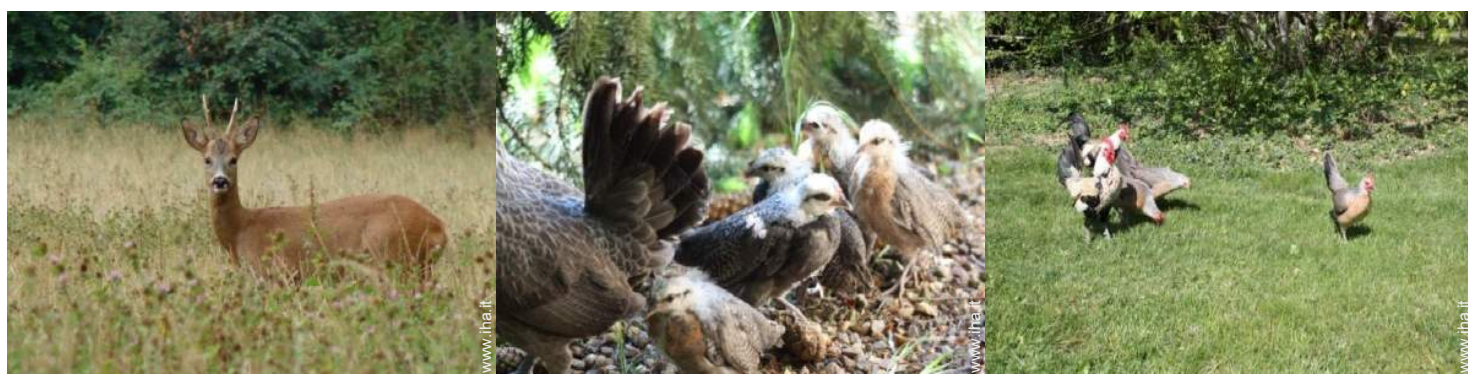
vista sulla campagna