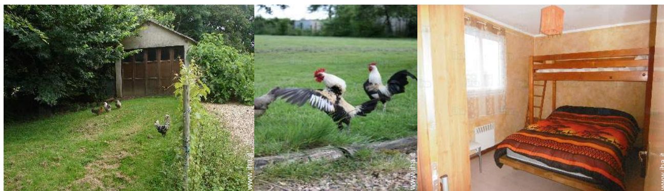
Gli animali domestici