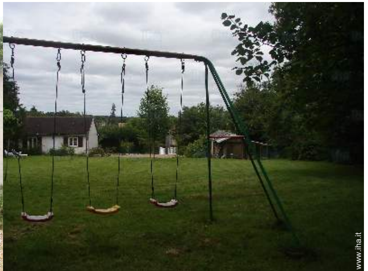
disposizione delle attrezzature ricreative