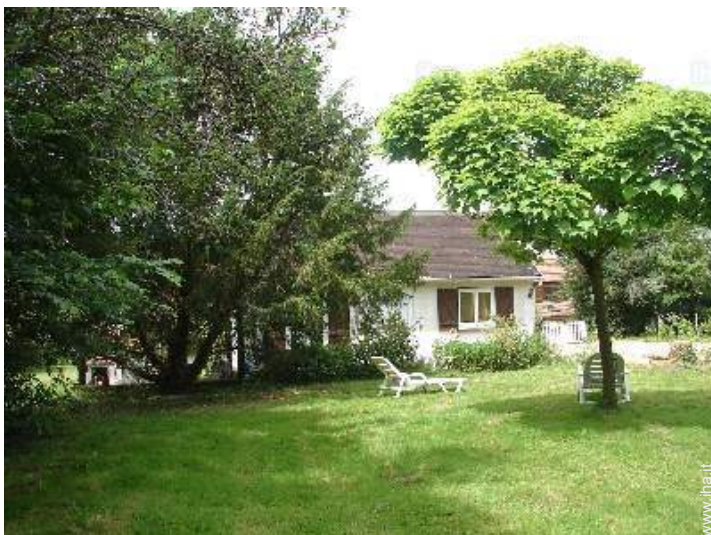
vista dalla proprietà