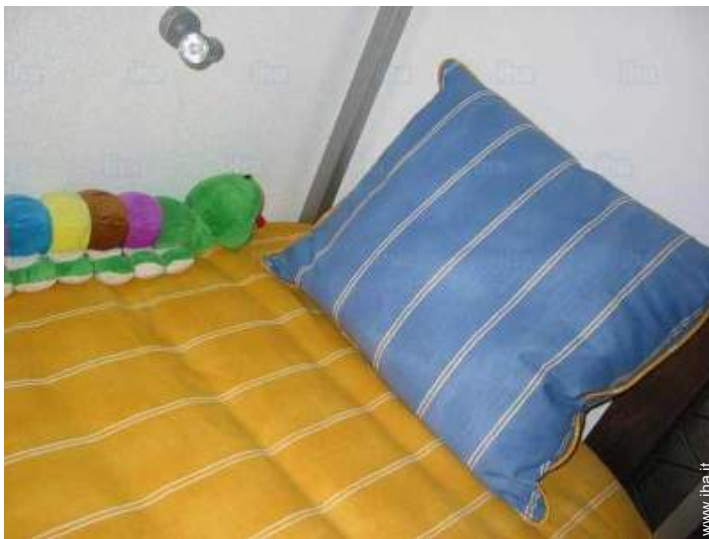
camera per ragazzi