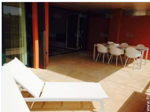
vista dal salone