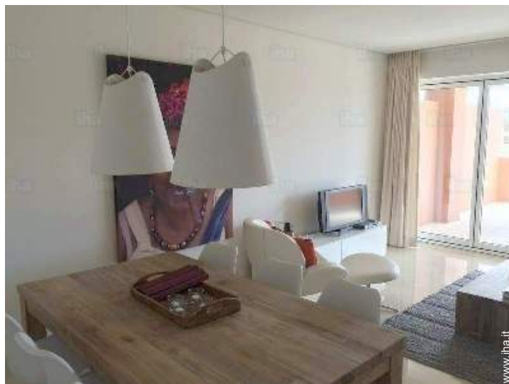
Disposizione interna e comfort