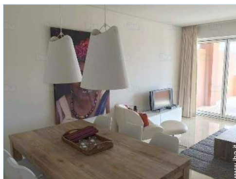
Disposizione interna e confort