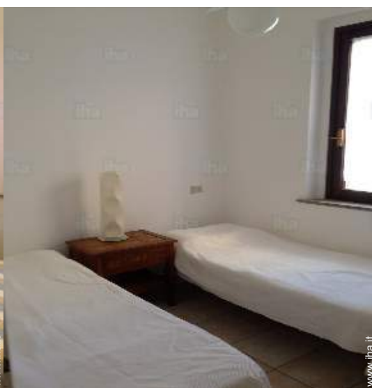
camera per ragazzi