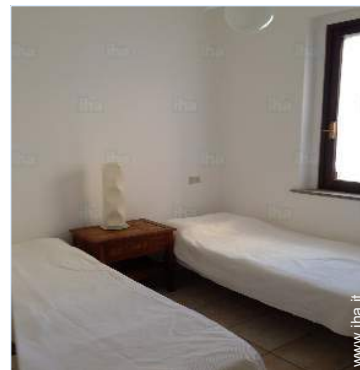
camera per ragazzi

Mare/oceano 500m Spiaggia 500m Campo da tennis pubblico 1km Punto di windsurf 1km Centro nautico 800m Marina 1,5km Scalo di alaggio per la barca 5km