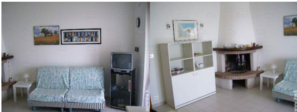
divano(i) letto 2 pers