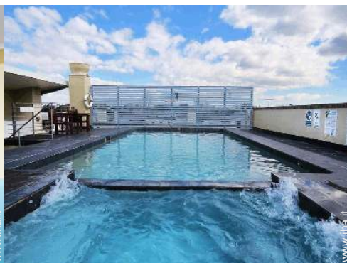
piscina in comune