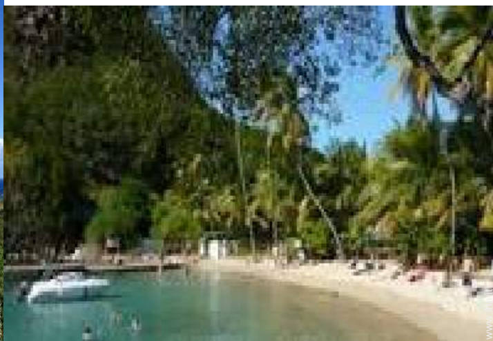
attrezzature ricreative nelle vicinanze