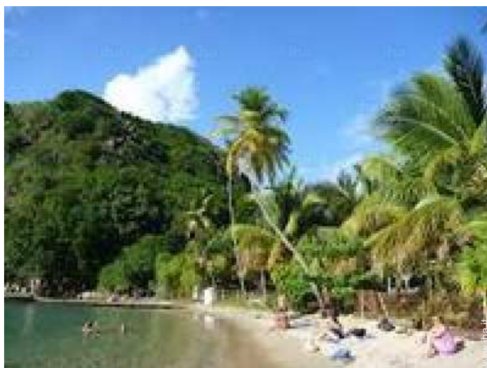
attrezzature ricreative nelle vicinanze