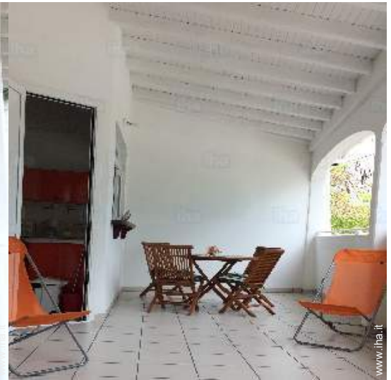
vista dal terrazzo coperto