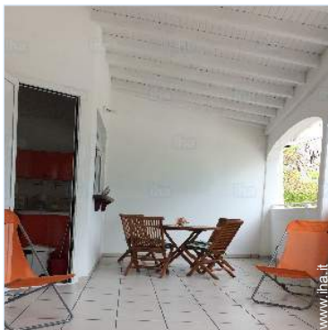
vista dal terrazzo coperto